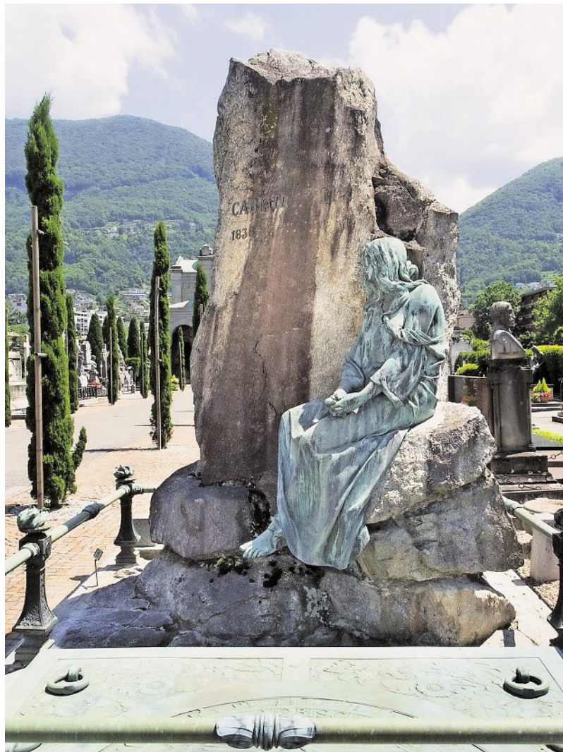
MEMORIE La tomba di Emilio Cabiati realizzata da Raimondo Pereda nel 1903